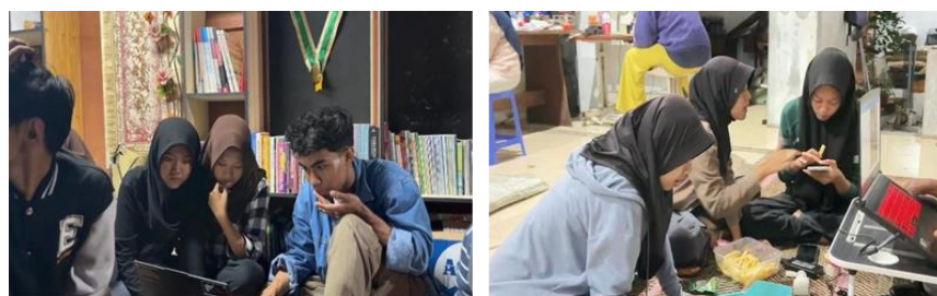
Gambar 2. Dokumentasi Kegiatan Digitalisasi Perpustakaan Desa Badran

Program ini juga mendorong tumbuhnya literasi digital di kalangan pengelola dan masyarakat. Mereka tidak hanya menjadi pengguna teknologi, namun juga produsen informasi yang aktif dan kreatif. Secara keseluruhan, program digitalisasi Perpustakaan Desa Badran berdampak pada perubahan budaya literasi masyarakat dari yang pasif menjadi aktif, partisipatif, dan adaptif terhadap perkembangan teknologi. Sistem baru pada Taman Baca Sriwijaya mempermudah pengurus untuk memberikan informasi dan mendorong tumbuhnya minat baca di kalangan masyarakat desa yang terlihat dalam dokumentasi berikut ini: