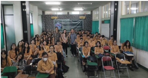
Gambar 1. Domuntadi Bersama Guru Pendamping SMK Katolik Santa Maria Pontianak

Kegiatan pengabdian kepada masyarakat ini bertujuan untuk meningkatkan kesiapan magang siswa SMK melalui edukasi manajemen konflik kerja. Kegiatan diikuti oleh siswa SMK Katolik Santa Maria Pontianak dan dilaksanakan dengan metode ceramah yang disertai evaluasi melalui pre-test dan post-test.