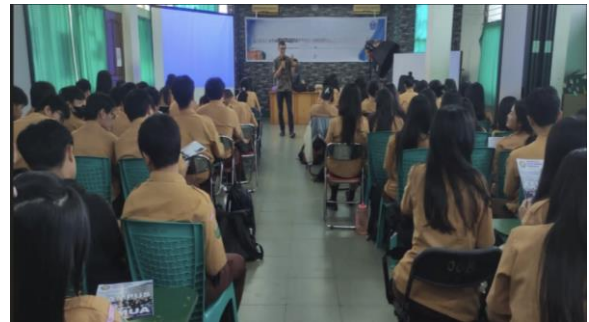
Gambar 2. Pemberian Materi